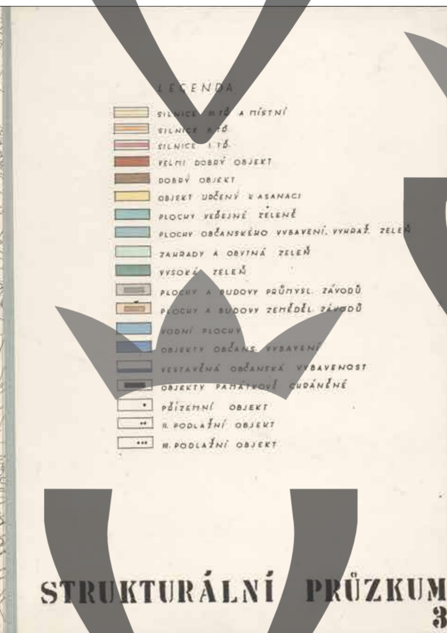
Mapa č. 17: Strukturální průzkum zástavby Pražského a Litomyšlského předměstí, 1968